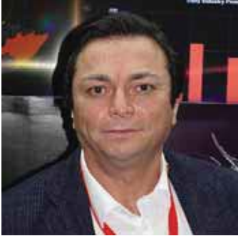
مجد سنان TREND MICRO