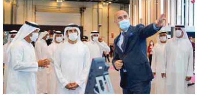
نضال ابو لطيف يشرح للشيخ حمدان بن محمد آل مكتوم عن آخر خدمات AVAYA