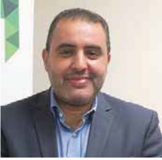
علاء الدين المقريف LEXMARK