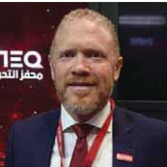
جهد طياره EVOTEQ

افتتح الشيخ حمدان بن محمد بن راشد آل مكتوم، ولي عهد دبي، في مركز دبي التجاري العالمي، فعاليات أسبوع جيتس للتقنية ضمن دورته الـ ٤٠ بحضور عالمي واسع النطاق ضم ١٢٠٠ مشاركة من جهات حكومية وشركات عالمية كبرى وناشئة ورواد أعمال و ٢٠٠ من أهم شركات الاستثمار في مجالات التكنولوجيا المتنوعة، ضمن الحدث التقني الأكبر في المنطقة، والاول من نوعه في العالم الذي يعقد فعلياً خلال عام ٢٠٢٠ وفقاً للإجراءات الاحترازية والوقائية الموصى بها عالمياً، ومن قبل الجهات المعنية في الدولة، بهدف ضمان أعلى مستويات السلامة للعارضين والمشاركين والزوار، وحمايتهم من فيروس «كورونا». وأشار الشيخ حمدان: «جيتس هو الحدث التقني الأكبر من نوعه في المنطقة، وهو منصة مهمة لحوار عالمي حول تقنيات المستقبل التي تحمل مفتاح الحلول لأغلب التحديات التي يواجهها الانسان، وديي انطلاقا من موقعها كمركز محوري للتكنولوجيا والابداع وريادة الاعمال، ملتزمة بتفعيل هذا الحوار وتوسيع نطاقه، بما يتناسب وطموحاتها لحياة أفضل ستكون التكنولوجيا العنصر الابرز في تكوين تفاصيلها». «البيان الاقتصادية» تفقدت الأجنحة الدولية المشاركة واستطلعت مديري الشركة ورؤساءها التنفيذيين عن أحدث التقنيات والحلول الرقمية والذكية المعروضة.