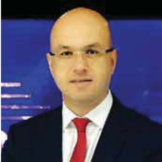
Zaidoun Arbad Starlink ME